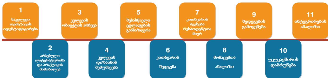
სქემა 2. კვლევის განხორციელების პროცედურები

პროცედურა 1. უნივერსიტეტის მიერ განსაზღვრული მისიის, სტრატეგიული განვითარების და ხარისხის უზრუნველყოფის სამოქმედო გეგმის მიხედვით სამსახური ყოველწლიურად ახდენს სისტემატიზებული საკვლევო თემების იდენტიფიცირებას (იხ. ცხრილი 1).